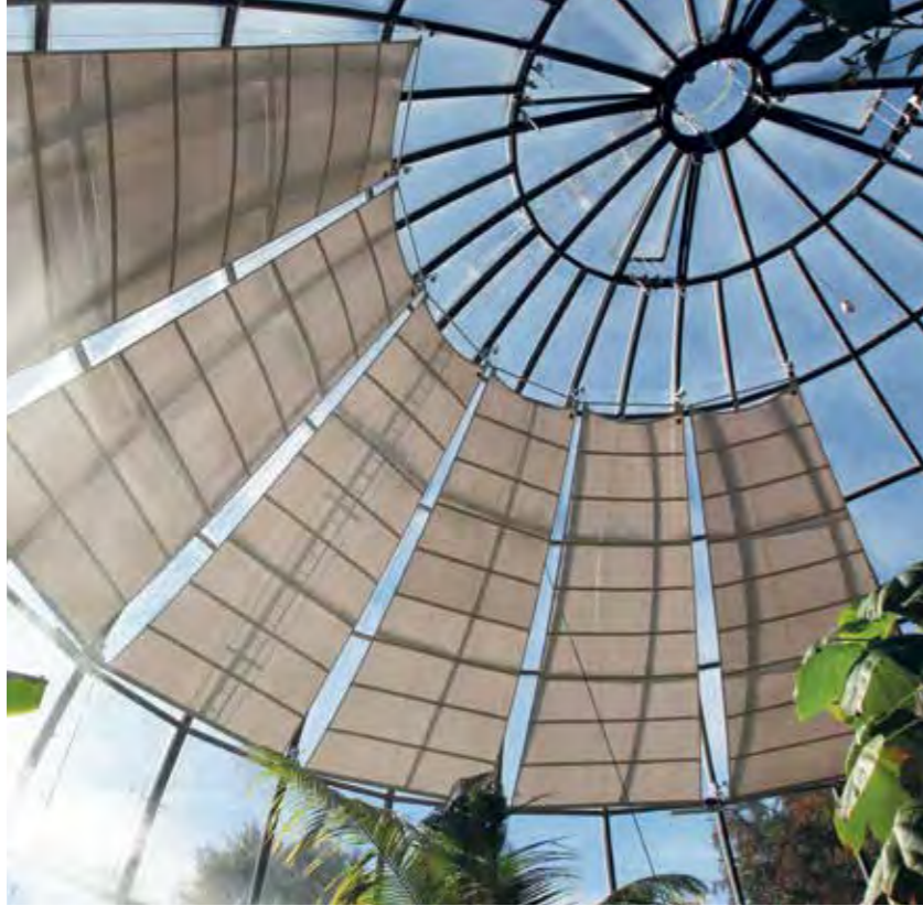
rechts: CANTILEVER - private Terrasse links: AX-40 - Botanischer Garten Zürich unten: SQK-80 - Burgenmuseum Reichenstein