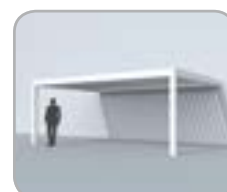
Fassadenmontage (2 Pfosten)