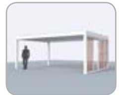
Spanseite mit Loggiawood® oder Loggiascreen® 4FIX