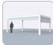
Kombination mit mehreren integrierten Fixscreen®