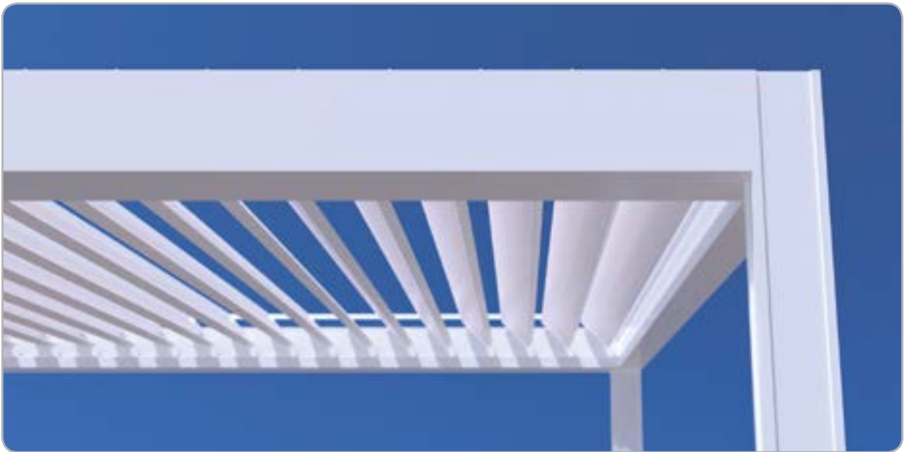
Im geöffneten Zustand: Sonnenschutz und Lüftung sind steuerbar