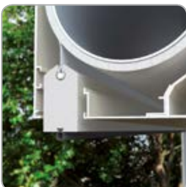
Integrierter Sonnenschutz: Endschiene ist in der Kassette verborgen