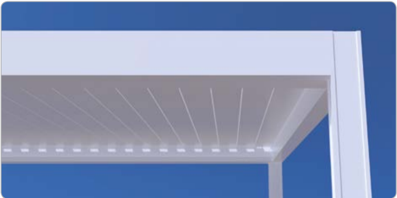
Im geschlossenen Zustand: wasserdichte Lamellen mit einer attraktiven gleichmäßigen und flachen Unterseite