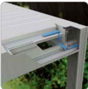
Effiziente integrierte Wasserabfuhr