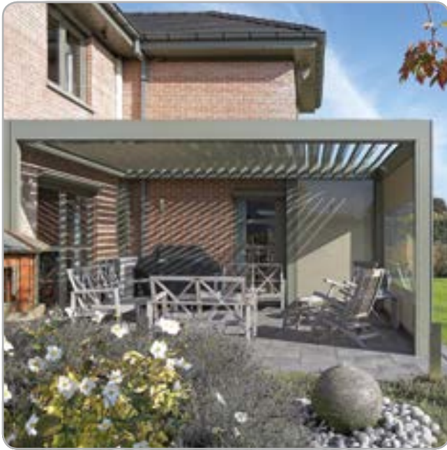
Integrierte windfeste Senkrechtmarkise realisiert mit Fixscreen®-Technologie