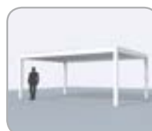
Freistehend (4 Pfosten)