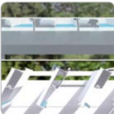
Kontrollierte Wasserabfuhr auch bei geöffneten Lamellen