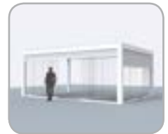
Pivot und/oder Spanseite mit Ganzglas - Schiebe-Systeme - wahlweise in Kombination mit integrierten Fixscreen®