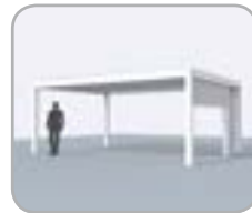
Pivot und/oder Spanseite mit integrierten Fixscreen® und Schiebetür realisiert mit Loggiascreen® 4FIX oder Loggiawood®