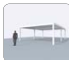
2-teilige Koppelung an Pivot- oder Spanseite möglich