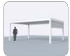
Spanseite mit integriertem Fixscreen®